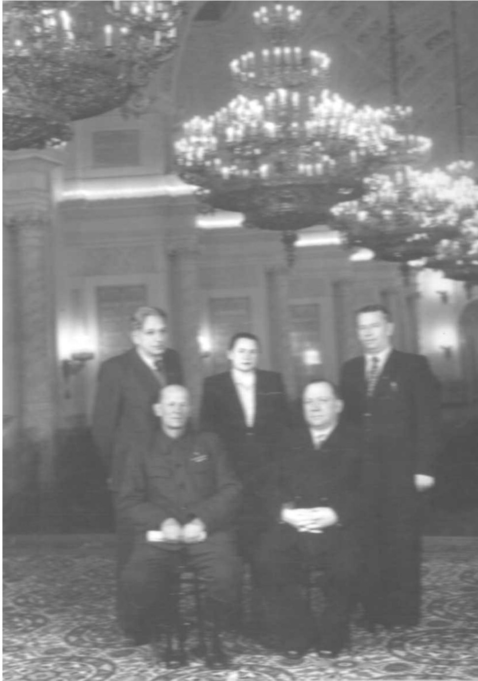
Георгіївський зал. Кремль. Москва. 1958 р.