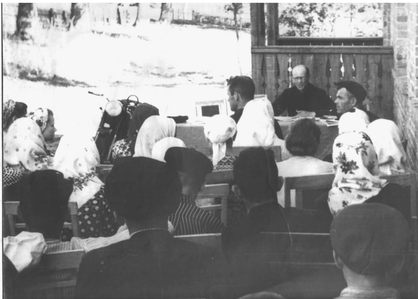
Колгоспники на агронавчанні

(його будинок до цього часу стоїть в селі Кіндрашівка по вулиці Нагорній, 3) у колгоспі постійно почали проводитися агронавчання. На цих заняттях активісти і передовики артілі знайомилися з передовою агротехнікою, вивчали досвід новаторів колгоспного виробництва.